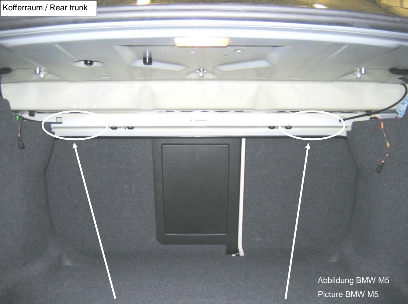
Abbildung BMW M5 Picture BMW M5