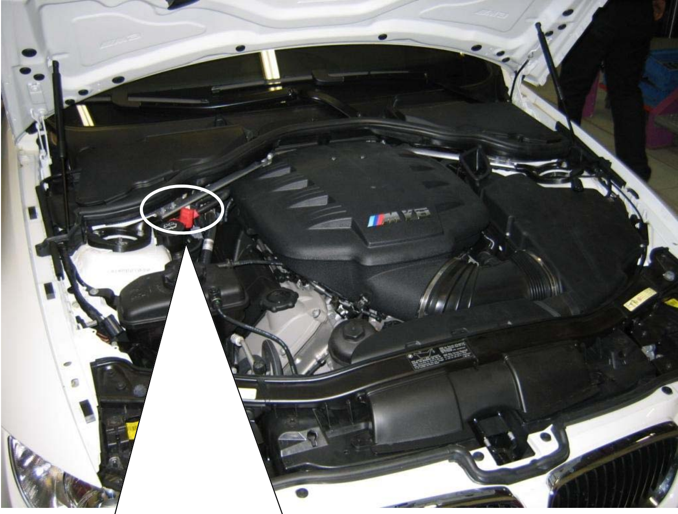
Montageort VA Elektroniksatz / Assembly area front axle electronic kit