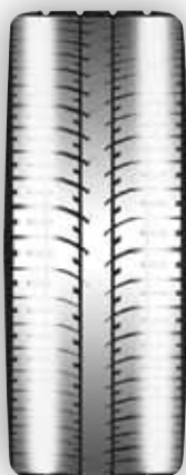
Desgaste del borde interno/externo

Si el ángulo de caída se aparta de la especificación ocasionará que el vehículo tire hacia la izquierda o la derecha, causando desgaste en el borde interno o externo del neumático.