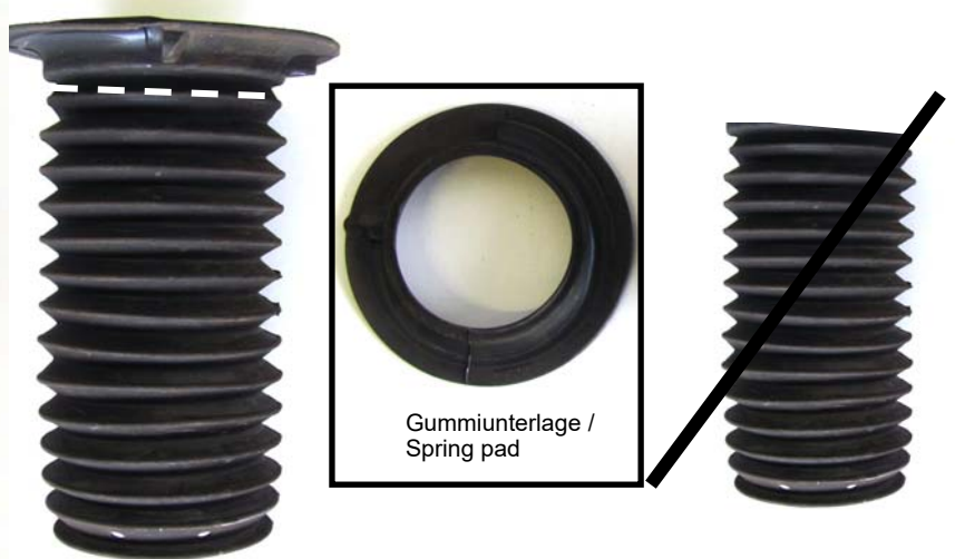
Gummiunterlage / Spring pad

Cut off the standard dust cover on the dashed line. Insert the top part of the dust cover on the spring. The lower part of the dust cover is no longer required.